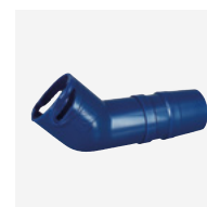
Cotovelo conector 45°