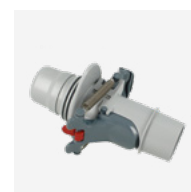
Válvula de regulação automática do caudal (skimmer)