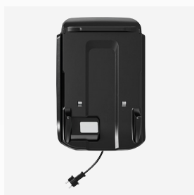
Base de carregamento e armazenamento