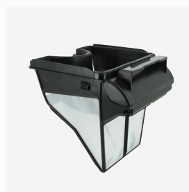
Filtro rígido Filtro: 100 µ