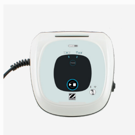
Caixa de comando