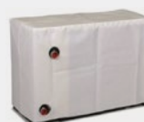
Capa de hibernação