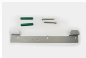
Kit de fixação de parede