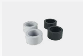
Kit de redutores a colar