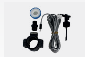
Kit de sensor de débito